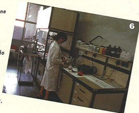
6 - La postazione per il calcolo della tossicità dei gas (AFNOR NF X 10.702 secondo AFNOR NF F16.101).