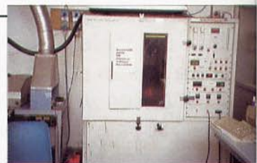
Forni tubolari per la determinazione della tossicità dei gas secondo AFNOR NF X 70-100