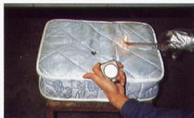
Prova di reazione al fuoco EN 597 parte 2 (piccola fiamma)