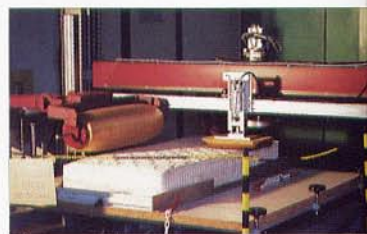
Apparecchiatura per la prova EN 1957

Grado di rigidità Hs: viene utilizzato per esprimere la valutazione soggettiva di diverse persone. È determinato sulla base del valore di durezza derivato dai risultati di studi empirici (punto 3.5 della UNI EN 1957). È un numero su una scala da 1 a 10 che esprime la rigidità di un materasso (punto 8.3 della UNI EN 1957) Hs = 1 corrisponde a un materasso rigido Hs = 10 corrisponde a un materasso morbido.